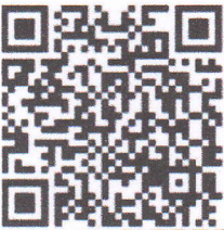
ГРАФИК ПЛАТЕЖЕЙ* к договору (контракту) от 07.01.2022 г. № 40825153

между O'ZBEKTELEKOM и Бўш турган объектлардан самарали фойдаланишни тшкил этиш бошқармаси на общую сумму 6000000,00