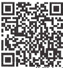
ГРАФИК ПЛАТЕЖЕЙ* к договору (контракту) от 05.01.2022 г. № С/Д-17

между "Chimboy tuman yo'llardan foydalanish" UK и Коракалпогистон Республикаси худудий автомобиль йуллари Бош бошкармаси на общую сумму 221378000,00