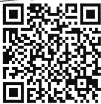
ГРАФИК ПЛАТЕЖЕЙ* к договору (контракту) от 03.02.2022 г. № 4117-2022

между ООО "UNICON-SOFT" и Учкудук тумани Маданият ва аҳоли дам олиш маркази на общую сумму 242850,00