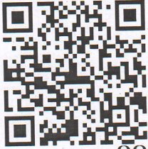
ГРАФИК ПЛАТЕЖЕЙ* к договору (контракту) от 02.02.2022 г. № 1

между ООО "SUXROB NUKUS" и Коракалпогистон Республикаси Кабуллар Уйи на общую сумму 2000000,00