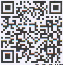
ГРАФИК ПЛАТЕЖЕЙ* к договору (контракту) от 31.01.2022 г. № 3Т

между ООО "RAVAZ-PLUS BIZNES" и Тошкент вилояти тери-таносил касалликлари дипансери на общую сумму 9000000,00