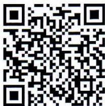
ГРАФИК ПЛАТЕЖЕЙ* к договору (контракту) от 03.02.2022 г. № 4254-2022

между ООО "UNICON-SOFT" и Учкудук туман тиббиёт бирлашмаси на общую сумму 1942800,00