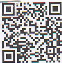
ГРАФИК ПЛАТЕЖЕЙ* к договору (контракту) от 27.01.2022 г. № D-2

между "Коракалпогистон компьютерлаштириш маркази" ДУК и КР Давлат архитектура ва курилиш кумитаси на общую сумму 210000,00