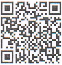
ГРАФИК ПЛАТЕЖЕЙ* к договору (контракту) от 03.02.2022 г. № 4230-2022

между ООО "UNICON-SOFT" и Сайхунобод тумани Тиббиёт бирлашмаси на общую сумму 780000,00