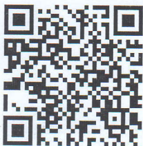
ГРАФИК ПЛАТЕЖЕЙ* к договору (контракту) от 24.01.2022 г. № 83/2022

между Узб Рес Кур ваз хузур Шахарсозлик хуж эксперт ДУК и Сирдарё Абу Али ибн Сино номидаги Жамоат саломатлиги техникуми на общую сумму 621000,00