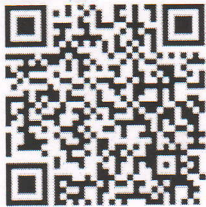
ГРАФИК ПЛАТЕЖЕЙ* к договору (контракту) от 01.02.2022 г. № А-100

между ООО "ASIA PHARM LYUKS" и Тошкент тумани Тиббиёт бирлашмаси на общую сумму 3252340,00