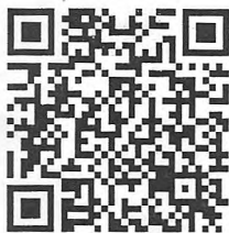
ГРАФИК ПЛАТЕЖЕЙ* к договору (контракту) от 03.02.2022 г. № 010079/2

между Сирдарё вилоят Электр тармоклари корхонаси и Гулистон шаҳар тиббиёт бирлашмаси(центр) на общую сумму 3232350,00