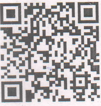
ГРАФИК ПЛАТЕЖЕЙ* к договору (контракту) от 21.01.2022 г. № 4

между "Сирдарё сув таминоти" МЧЖ и Ховос туман маданият бўлими на общую сумму 298350,00