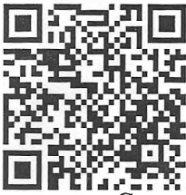
ГРАФИК ПЛАТЕЖЕЙ* к договору (контракту) от 03.02.2022 г. № 010079

между Сирдарё вилоят Электр тармаклари корхонаси и Гулистон сахар тиббиёт бирлашмаси(центр) на общую сумму 16512750,00