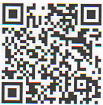
ГРАФИК ПЛАТЕЖЕЙ* к договору (контракту) от 28.01.2022 г. № 2/12

между "Олтинсой савдо ишлаб чиқариш" МЧЖ и Олтинсой туман МТБ на общую сумму 52649000,00