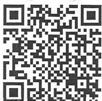
ГРАФИК ПЛАТЕЖЕЙ* к договору (контракту) от 03.02.2022 г. № 010079/1

между Сирдарё вилоят Электр тармоклари корхонаси и Гулистон сахар тиббиёт бирлашмаси(центр) на общую сумму 7006950,00