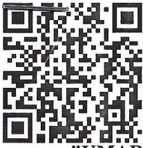
ГРАФИК ПЛАТЕЖЕЙ* к договору (контракту) от 01.02.2022 г. № 1

между "UMARJON BIZNES CITY" MChJ и Бука тумани Бандликка кумаклашиш мапкази на общую сумму 3400000,00