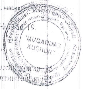
Схема сертификации: СХЕМА № 3 Заявитель (изготовитель, продавец) ЧП "SIFATLI TOVUQ" (нужно подчеркнуть)

Адрес: Республика Узбекистан, г. Ташкент, Бектемирский район, ул. Олтинташ, 25 Пр-во. Республика Узбекистан, г. Ташкент, Бектемирский район, ул. Олтинташ, 25 Сертификат выдан на основании (адрес)