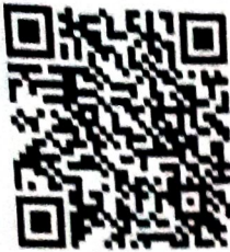
ГРАФИК ПЛАТЕЖЕЙ* к договору (контракту) от 3 .02.2022 г. № 2/180

между "Хоразм Дори-дармон" МЧЖ и Янгиарик туман Тиббиёт бирлашмаси на общую сумму 4983358,00