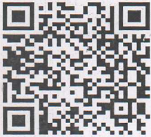
ГРАФИК ПЛАТЕЖЕЙ* к договору (контракту) от 19.01.2022 г. № 54

между Гулистон Нефтбаза МЧЖ и Ховас туман Санитария-эпидемиология осойишталик маркази на общую сумму 2996658,37