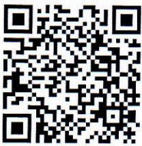
ГРАФИК ПЛАТЕЖЕЙ* к договору (контракту) от 07.02.2022 г. № 83-Б

между Навоий "Дори дармон" АЖ и Учкудук туман тиббиёт бирлашмаси на общую сумму 2807114,00