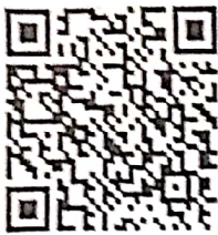
ГРАФИК ПЛАТЕЖЕЙ* к договору (контракту) от 26.01.2022 г. № 14/01-10

между РММФТЭНММ и Ширин шаҳар Маданият бўлими на общую сумму 399000,00